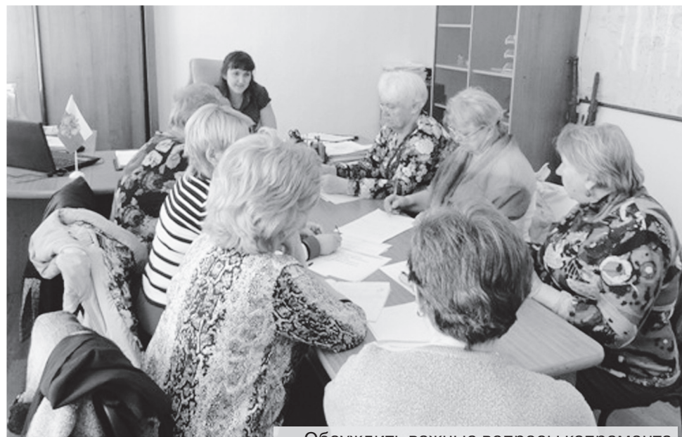
Обсудить важные вопросы капремонта можно со специалистом

Приглашаем жильцов принять участие в обучающем семинаре по теме: «30-летняя программа капитального ремонта», который проводится каждый четверг в 15 часов по адресу: г. Артем, ул. Севастопольская, 29/1. Предварительная запись по телефонам: 8 (42337) 38-8-38, 38-3-38.